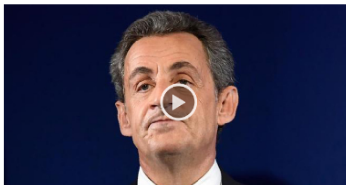
Nicolas Sarkozy será juzgado por la financiación ilegal de la campaña de 2012.

Diagnóstico gratuito, tasa de éxito 97%. ¡Más de 140.000 clientes satisfechos!