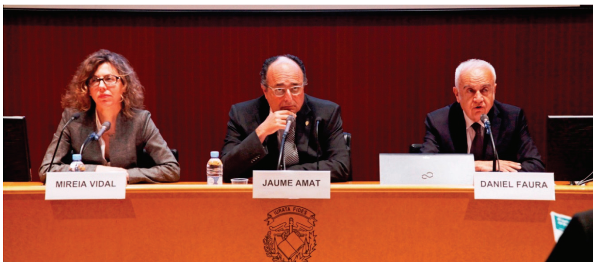
El síndic major, flanquejat per la interventora general de la Generalitat de Catalunya i pel president del Col·legi de Censors Jurats de Comptes de Catalunya, durant la inauguració de la sisena Jornada d'auditoria del sector públic.