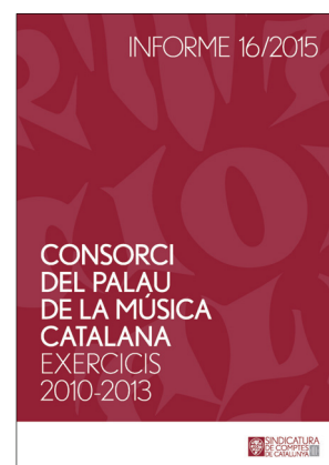
Alguns informes del 2015.