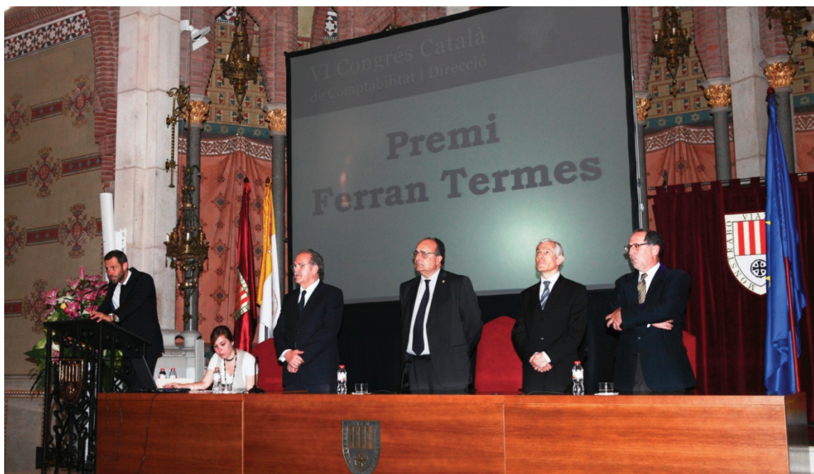
Acte de lliurament del I Premi Ferran Termes durant el VI Congrés Català de Comptabilitat i Direcció.