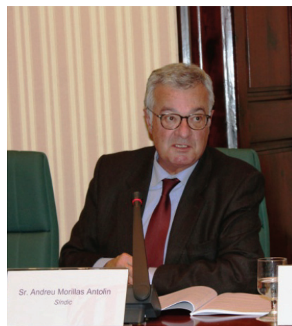
El síndic Andreu Morillas presenta un informe a la Comissió parlamentària del 3 de març.