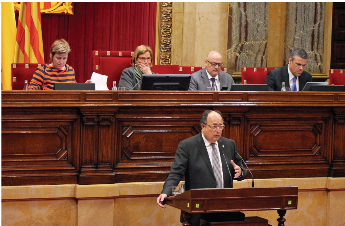
Compareixença del síndic major davant el Ple del Parlament, el 19 de març, per presentar l'informe relatiu al Compte general de la Generalitat de l'exercici 2012.

El síndic major, Jaume Amat i Reyero, va comparèixer davant el Ple del Parlament en la sessió del dia 19 de març per presentar l'informe 15/2014, sobre el Compte general de la Generalitat corresponent a l'exercici 2012, d'acord amb el que preveu l'article 163.5 del Reglament del Parlament de Catalunya. La sessió plenària va comptar amb la presència dels membres del Ple de la Sindicatura de Comptes.