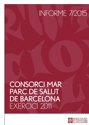
Alguns informes del 2015.