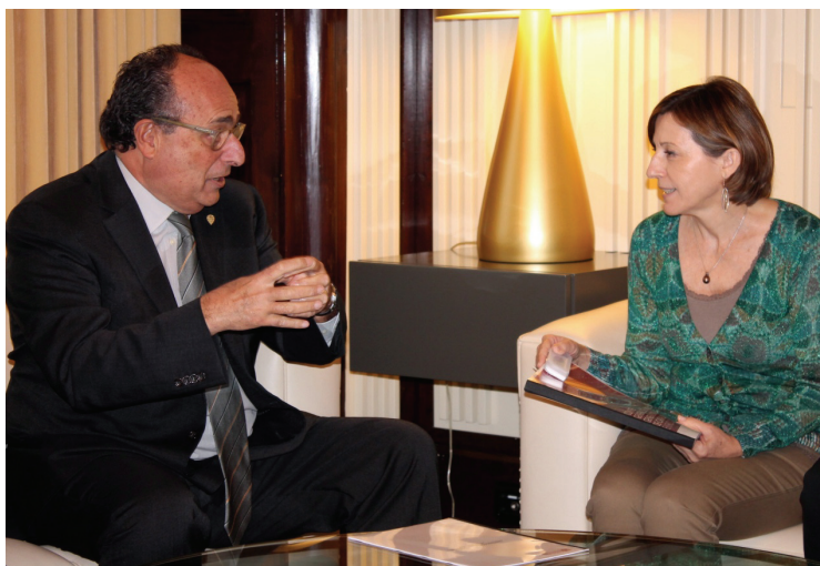
El síndic major, Jaume Amat, lliura l'informe sobre el Compte general de la Generalitat de l'exercici 2013 a la presidenta del Parlament, Carme Forcadell.

lunya, el síndic major, acompanyat dels membres del Ple de la Sindicatura, va lliurar a la presidenta del Parlament, Carme Forcadell i Lluís, en presència de la resta dels membres de la Mesa, l'informe de fiscalització del Compte general, en suport físic i electrònic, i també va presentar el Programa anual d'activitats de la Sindicatura de Comptes de Catalunya per a l'any 2016, que, d'acord amb l'article 161 del Reglament del Parlament, s'ha de presentar abans de l'1 de desembre.